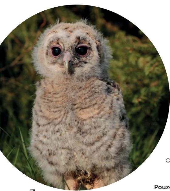
↗ Mládě puštíka obecného